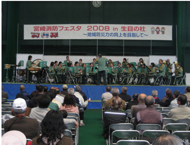
消防フェスタ会場での演奏風景