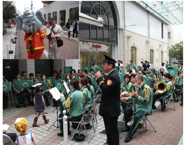
ポケットパークでの演奏と広報状況