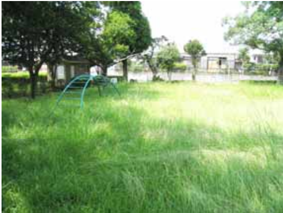
公園の草が伸びている状況