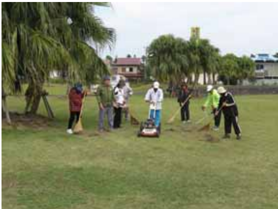
愛護会が草刈をしている状況