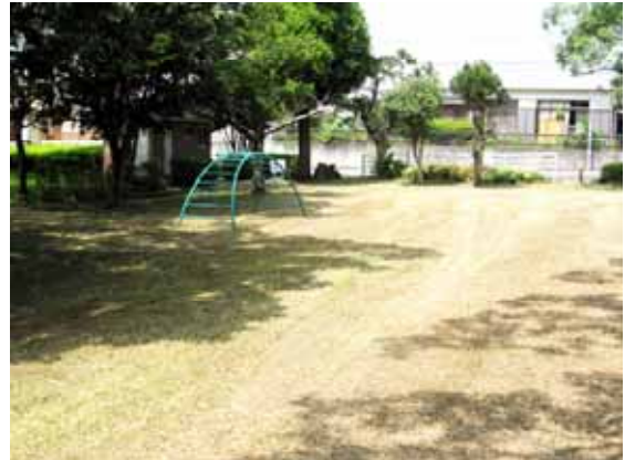
草刈を行った後の状況