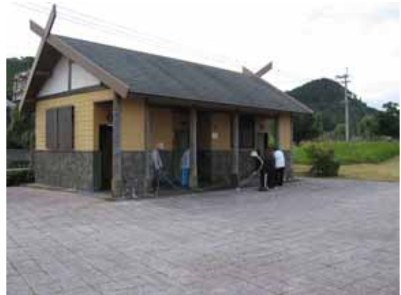
愛護会がトイレ清掃を行っている状況