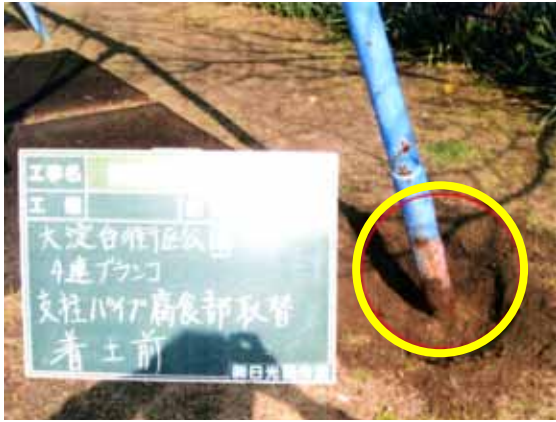
プランコ支柱腐食改修前