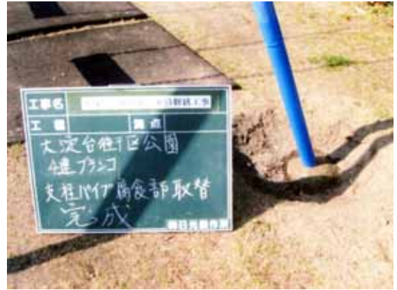
プランコ支柱腐食改修後