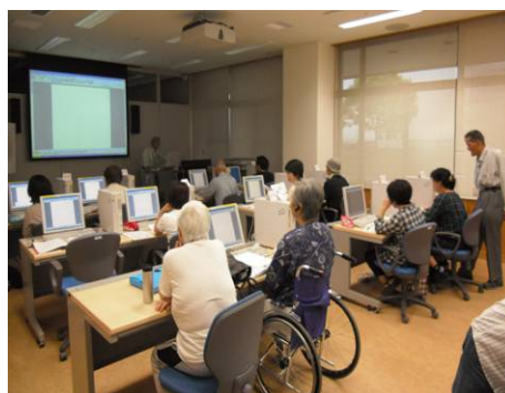
パソコン入門講座