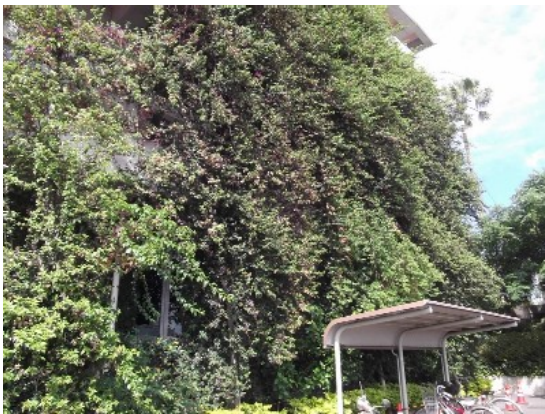
ブルーゲンビルア (本庁舎南側)