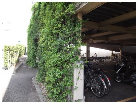
立体駐輪場の植栽