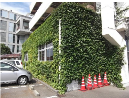
本庁舎壁面のアイビー