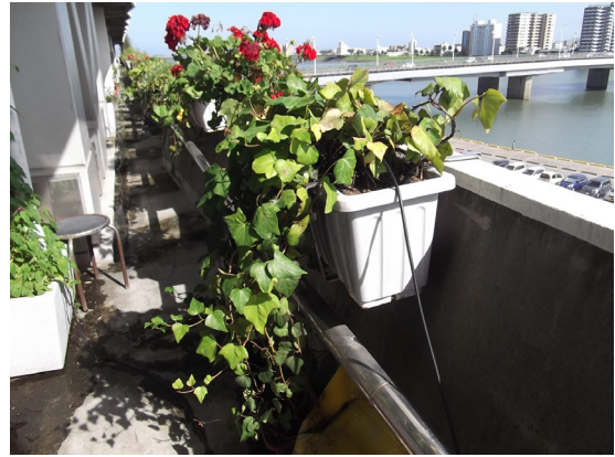
自動灌水装置 (本庁舎ベランダ)