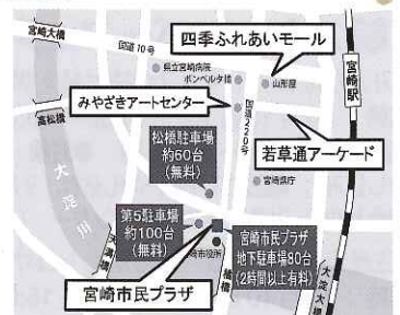
中心市街地アクセスマップ