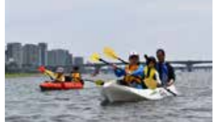
大淀川で開催されたカヌー教室