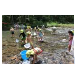
鏡洲保育園が参加した水辺調査