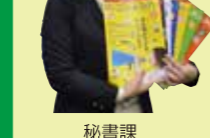
秘書課 もとい 本市 彩

市広報みやざきは、5月号から官民協働により作成し、紙面も32ページフルカラーと、大きく変わりました。今までになかった動画との連動企画や紙面構成にたくさんの反響をいただいています。これからも、市民の皆さんに「愛され、親しまれる」広報紙となるようがんばります。