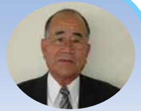
おおよど福祉まつりとまちづくり