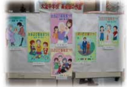
大淀中美術部のみなさんが描いたポスター