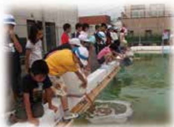
EM菌のプール散布～大淀小学校～(9月11日・火)