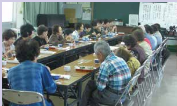
住民のみなさん同士、おしゃべりしながら会食中!! 地域の絆も深まります。