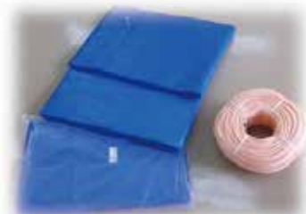
防災倉庫用資材(ブルーシート・ロープ) 倉庫設置自治会22ヶ所へ配布