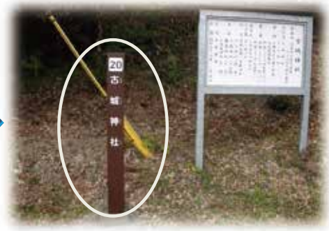
史跡表示板設置完了