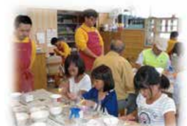
エコクリーンプラザみやざき見学会(10月5日・金)