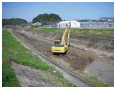
土砂除去中（古城川）