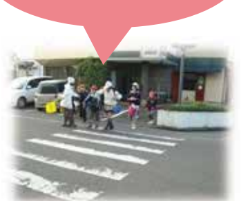
安全に登校 見守り隊