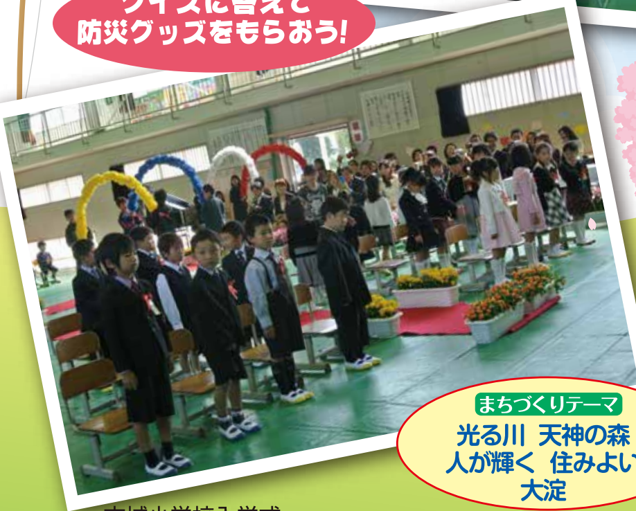
古城小学校入学式