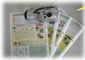
「元気だより」の裏表紙に 「防災クイズ」を掲載(年4回)