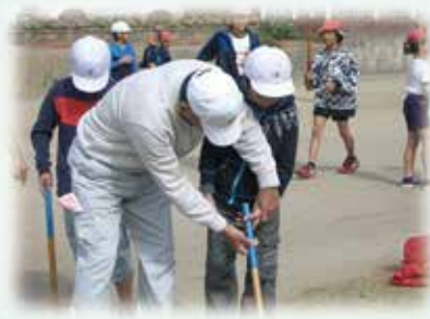
大淀小・古城小でのデモンストレーション (10月24日(水)・31日(水)・11月1日(木))