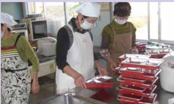
みなさんの喜ぶ笑顔が見たくって、愛情こめて健康弁当を作ってます。(調理ボランティアの方々)