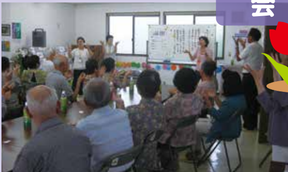
花山手自治会との共催で、高齢者を対象とした楽しい会食会を開催!!