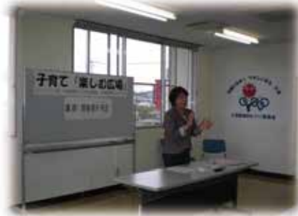
講師より“親業”について貴重なお話を聞く(5月26日・6月30日)