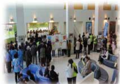
600名を超える来場者で賑わった 第1回「おおよど福祉まつり」