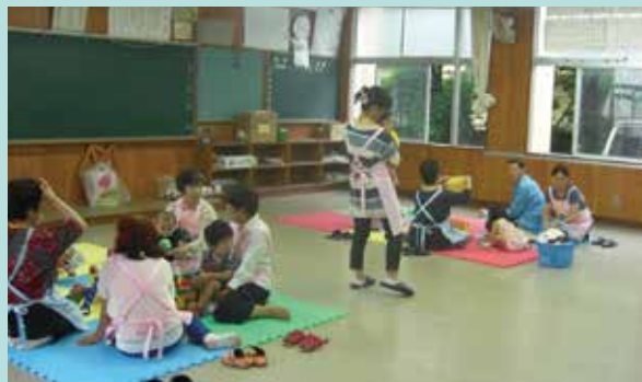
「大淀小学校 参観日こども預り」 年3回低学年参観日に実施、ボランティアさん、スタッフ10名程で対応しています。