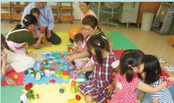
「古城小学校 参観日こども預り」 年3回参観日に実施、PTA 研修でもお預かりしました。