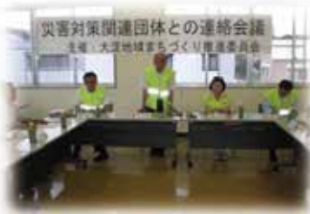
災害対策関連団体との 連絡会議(7月7日・土)