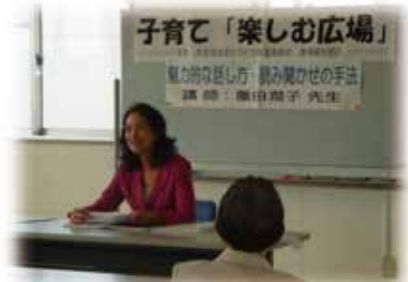
実演を交えての講演“読み聞かせの手法” (2月10日・3月10日)