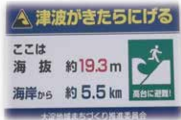
大淀地区に設置した「標高及び海岸からの距離」 標識版を新たに8ヶ所に設置