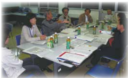
よりよいビジョンを策定するために住民千名を 対象にアンケートを実施しました。