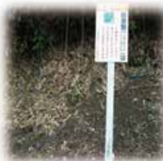
ごみやフンなどのポイ捨て禁止の看板を作成して自治会へ配布しました