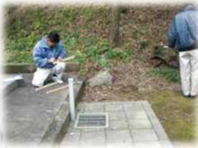
設置作業工事の様子