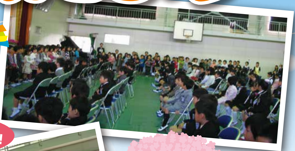
大淀小学校入学式