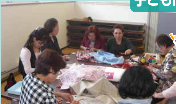
「布でボールを作ろう」 こども預りボランティアの方々が、こどもの遊び道具をつくりました。手作りのおもちゃで待っています。