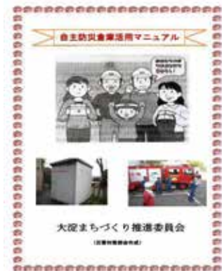
「自主防災倉庫整備マニュアル」作成