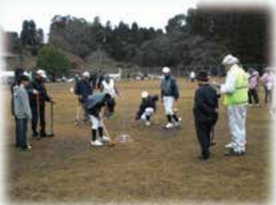
一昨年度の大会の様子