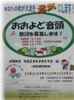
30余名の皆様から素晴らしい歌詞を 応募いただきました。