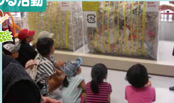
「エコクリーンプラザ見学会」 夏休みの楽しい思い出をつくらせたいと、地域の方々と出かけました。