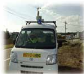
大淀ブルーパトロール隊巡回事業