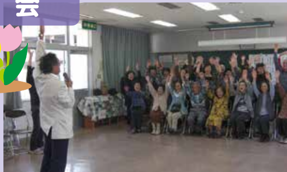
大淀地区全体を対象とした「おたのしみ会食会」 みなさんに参加していただけるよう、実施場所をかえて開催していきます。