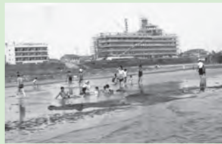
昭和38年頃の大淀川で遊ぶ子どもたち。後ろには建設中の市庁舎も見えます。

今回は夏休みの苦しい思い出をひとつ。私の実家は淀川に近く、当時は水も澄んでいたため夏は川泳ぎやダクマエビ(テナガエビ)採りなどをして開放的に過ごしたものでした。また、当時は広い中洲があり、浅瀬から自由に行き来することができました。ある日、友だち数人でバーベキューをしようと、炭や鶏肉などの食材を持ち寄り、中洲に渡って楽しく遊んだことがありました。ところが急に水かさが増し、浅瀬はみるみる腰の高さまで水に浸かってしまいました。幸いなことに、対岸に大人の方がいたので無事に渡ることができて事なきを得ました。今思うとダムの放流での増水と考えられ、楽しさが一変、大変なことになったかもしれません。改めて災害などの不測の事態は常に想定すべきと反省させられた出来事となりました。