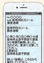
メール配信イメージ