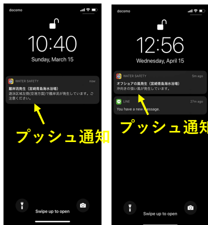
(a) 離岸流発生時 (b) 沖向きの強風発生時