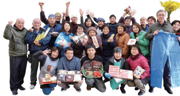
関連店舗の皆さん

関連店舗は、いつも元気いっぱい! お客様への声掛けや距離感を大切に、昔ながらの商店街の雰囲気を楽しめるよう工夫しています。カンカン市では、季節ごとの振る舞いなど楽しい企画が盛りだくさん! 多くの皆さんに来ていただき、各店舗でのやりとりを楽しんでいただきたいですね。