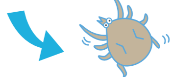
※マダニは3mm~8mm程度の大きさです。 マダニ