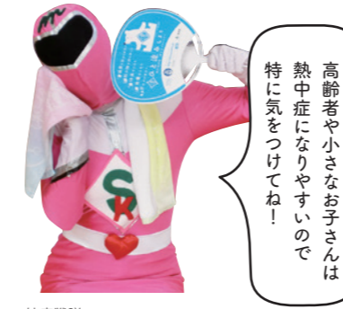
健康戦隊 カイゼンジャー ピンク 高齢者や小さなお子さんは熱中症になりやすいので特に気をつけてね！

熱中症の搬送者は平成27年5月の時点で全国2904人と、9月1か月間の搬送者数よりも増加しています。春から日差しが強くなり、気温が高くなる宮崎市。今のうちから汗をかく運動習慣を身に付けるなど、早めの対策で熱中症から身を守りましょう。