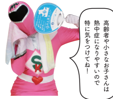
健康戦隊 カイゼンジャー ピンク

熱中症の搬送者は平成27年5月の時点で全国2904人と、9月1か月の搬送者数よりも増加しています。春から日差しが強くなり、気温が高くなる宮崎市。今のうちから汗をかく運動習慣を身に付けるなど、早めの対策で熱中症から身を守りましょう。