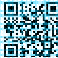
専用フォーム QRコード