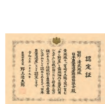
日本農業遺産の認定証。

田野・清武地域は、露地野菜を「干し野菜」として加工・販売する伝統が約100年前から受け継がれているとともに大根を丸々一本干して加工する独自の伝統技術を発展させてきました。今回