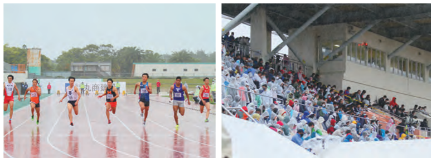
雨の中、力走するアスリートたち。