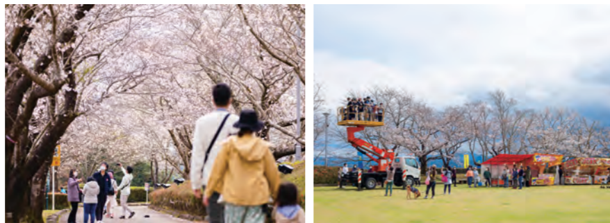
春の訪れを告げる桜並木。