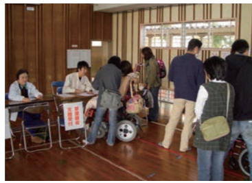
避難時には支援が必要な人への協力をお願いします。

から声を掛け合い、「コミュニケーション」を取るようになってください。災害が発生した際は、まず自分や家族の安全確保が第一となります。その上で、隣近所に手助けが必要な人がいる場合は、その人への情報伝達や、安否確認、避難所までの誘導に協力をお願いします。