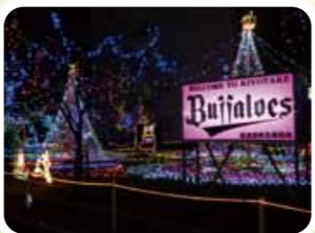
清武町イルミネーション

平成29年3月 発行 発行：清武地域自治区地域協議会 (事務局：宮崎市清武総合支所地域総務課) 〒889-1696 宮崎市清武町西新町1番地1 TEL0985-85-1111