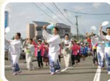
きよたけ郷土祭り