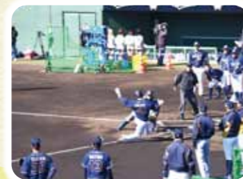
オリックス・バファローズキャンプ