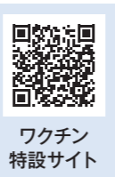
ワクチン特設サイト

※個別接種を実施している各医療機関の情報は「コロナワクチンナビ」(厚生労働省ホームページ)でもご確認できます。