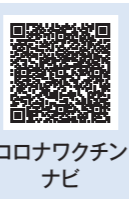
コロナワクチンナビ