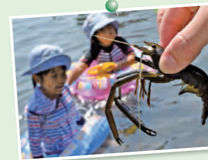
宮崎の日差しを浴びながら夏の楽しい思い出を作りましょう。

昨年からの新型コロナウイルス感染症の影響により、行事やイベントの中止もしくは延期が続いております。コロナ禍の中であっても、子ども達には「夏の思い出作り」をしてほしいと切に願います。