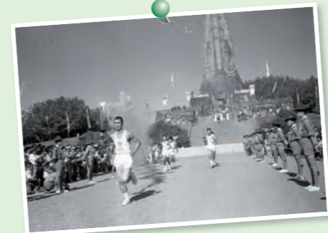
1964年東京オリンピック聖火リレーの様子(平和公園)。

今夏、日本では1964年以来57年ぶりにスポーツの祭典である東京2020オリンピック・パラリンピック競技大会が開催されています。