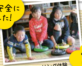
初めてのカラーリング体験