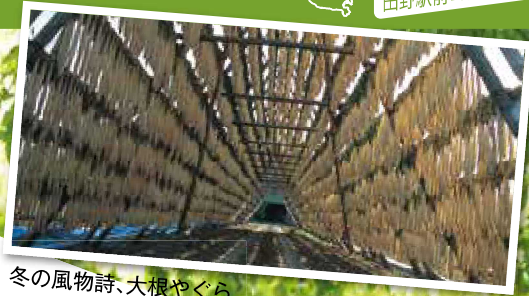
冬の風物詩、大根やぐら