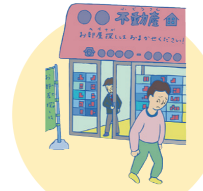
障がい者向け物件はないといって対応しない。