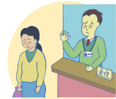
受付の対応を拒否する。