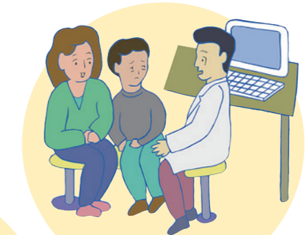
本人を無視して 介助者や支援者、付き添いの人だけに話し掛ける。