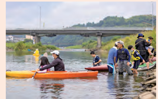
清武川でのカヌー教室