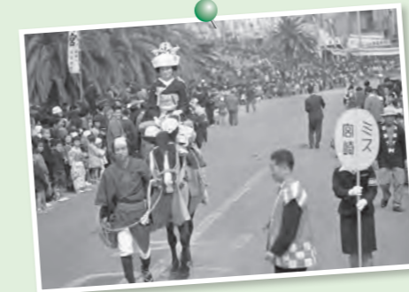
宮崎神宮大祭(1962年)のひとコマ。

「神武さま」で知られる宮崎神宮大祭は、秋の宮崎を彩る県下最大の祭として、多くの市民に親しまれています。