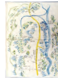
戊辰九月十五日の戦況図 (現大仙市協和境)

明治政府を樹立した薩摩藩・長州藩らの新政府軍と旧幕府軍との戦い。新政府側についた秋田藩は、薩摩、佐土原など14藩から駆け付けた約8千人(佐土原藩は約100人)の藩士とともに、旧幕府軍を追撃しました。この戦いで佐土原藩士8人が戦死しています。