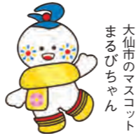
大仙市のマスコット まるびちゃん

秋田県大仙市 面積: 866.79km 2 (令和2年10月1日現在) 世帯数: 31,554世帯 (令和3年7月末現在) 人口: 78,304人 (令和3年7月末現在)