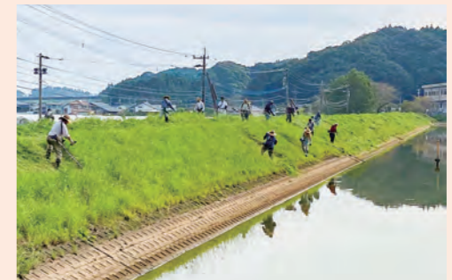
写真は地区内にある西田池での草刈り