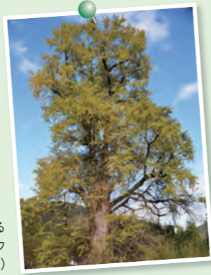
秋を彩る 去川大イチョウ(高岡町)

秋の深まりを感じる季節となりましたが、ここ数年は季節外れの暖かい日があり、季節感が失われつつあります。