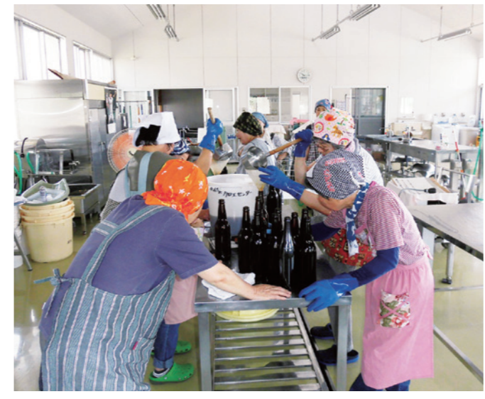
農産物加工施設での加工の様子

市内には食品加工ができる農産物加工施設があります。農畜産物などを使って、自宅などで消費する味噌やめんつゆなどの製造に利用できます。加工品の材料調達や加工作業は利用者で行う必要がありますが、機械の使い方などは指導員が指導します。ただし、販売目的や個人での利用はできません。