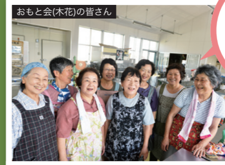
おもと会(木花)の皆さん 今朝は8時半から集まって作りました。おいしくできたので、子どもたちやご近所に配ります！