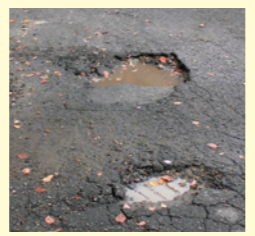
このような陥没や、穴のあいている箇所は危険です。

道路の穴ぼこは、車両の事故や歩行者のけがにつながる恐れがあります。見つけた場合は、道路維持課または総合支所建設課まで連絡をしてください。