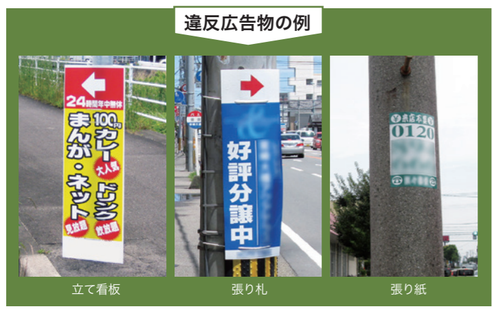
立て看板 張り札 張り紙

通勤や通学、散歩などの途中で、違法な掲示物を見つけたことはありませんか？ 道路上の電柱や街路灯、街路樹などに掲示された張り紙や張り札、立て看板などは、屋外広告物条例違反です。景観に配慮したきれいなまちづくりに、協力をお願いします。