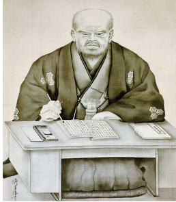
郷土の偉人 江戸末期～明治の大漢学者 安井 息軒

江戸期漢学を大成した安井息軒は宮崎市清武町中野に生まれ幼少期から学問を志した。二十一歳で大阪留学、二十五歳で江戸の昌平坂学問所に入り、「誓いて人の為す能わざる所を為さん。」と心に決め、中国古典の研究に打ち込んだ。二十八歳の時帰藩し、父・滄洲とともに明教堂や振徳堂で子弟の教育にあたった。父の死後、江戸で三計塾を開くと全国から優秀な人材が集まった。門下生からは谷千城、陸奥宗光をはじめ明治時代に知事・大臣など高位高官になったもの、陸軍大将、海軍少将、大学教授、漢学者など全国に二〇〇〇人のぼる優秀な人材を輩出した。