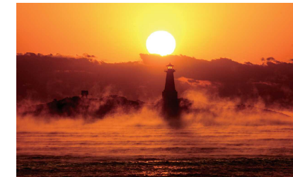
神武天皇お船出の地 美々津