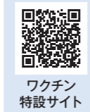
ワクチン特設サイト

宮崎市新型コロナワクチンコールセンター 0985-78-0567 8:30~19:00 年中無休 ※おかけ間違いにご注意ください。