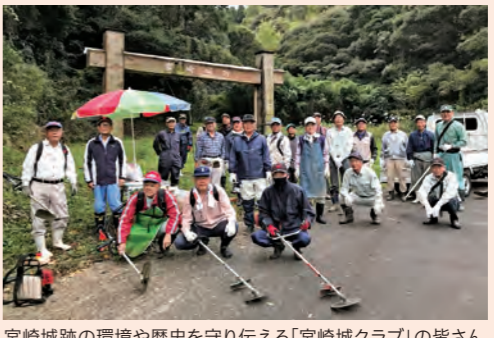
宮崎城跡の環境や歴史を守り伝える「宮崎城クラブ」の皆さん

歴史的な史跡がつなぐ世代の絆 池内地区の自慢は、史跡「宮崎城跡」がもたらす地域の輪です。昔から「城」の地名で親しまれてきたこの地を次代に伝えていきたいと、1996年に「宮崎城クラブ」が発足しました。山道の修復・草刈など環境整備のほか、子どもたちへの学習会なども行っています。城は関ヶ原の戦いで落城しましたが、瓦屋根の屋敷が建っていた大規模な山城であったことが判明。現在、国史跡の指定に向けて市が事業を行っています。城は時を超え、歴史と地域の絆を深めています。 (問) 宮崎市自治会連合会 TEL61-9065 FAX61-9066