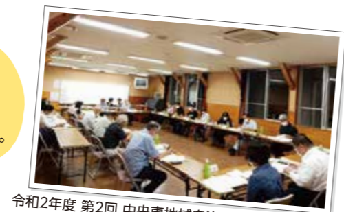
令和2年度 第2回 中央東地域自治区地域協議会の様子