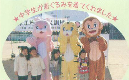
★中学生が着ぐるみを着てくれました★ 今回の防災訓練に本郷中学校の生徒達も参加してくれました。

災害はいつ何どき何が起こるか分かりません。日頃の備えが大切です。私は34年間消防団に携わってききましたが、やはり日頃の備えが大切なことを痛感しています。防災について少しでも意識を持ち、災害に強いまちづくりをしていきましょう。