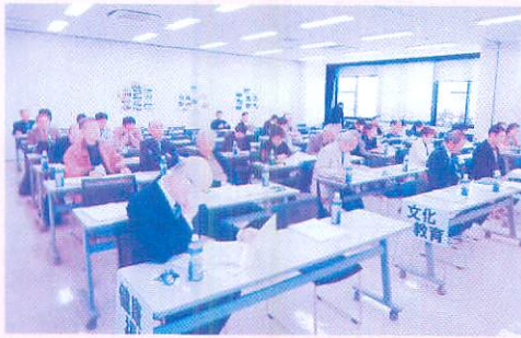
今年度の総会の様子