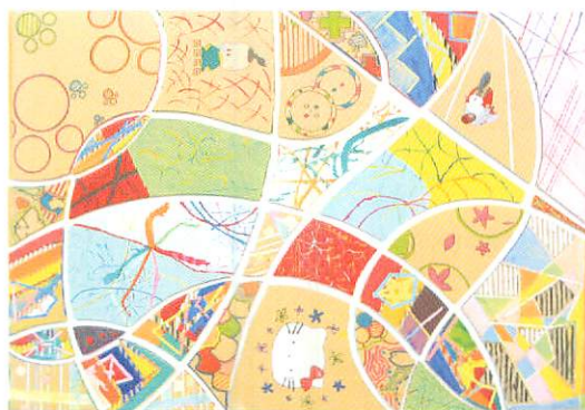
赤江まつばら支援学校 高等部 共同制作作品

先日開催いたしました赤江まちづくり推進委員会理事会(9/17開催)と臨時総会(9/25開催)の資料表紙として、赤江まつばら支援学校の生徒さん達が素晴らしい絵を提供してくださいました。今後もこのような形でまちづくりの活動へ参加して下さるとことです。このような繋がりが嬉しいです。