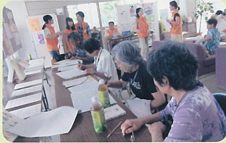
南九州大学・地域包括支援センターと共催 健康・福祉部会