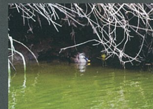
八重の鴨 村社 香織