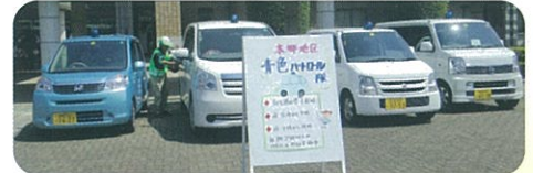
本郷地区青パト隊