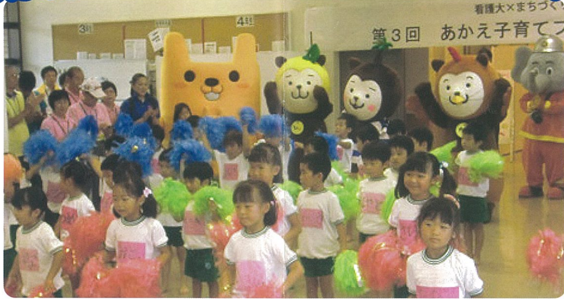
オープニングセレモニー(南ヶ丘幼稚園)