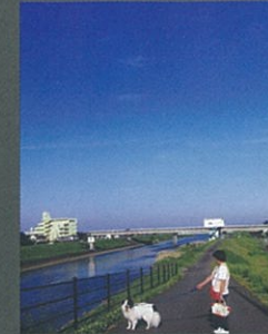
散歩道 嶋末 有希