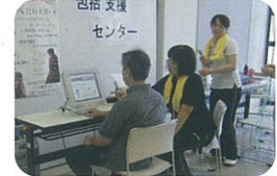
脳内年齢測定・介護相談