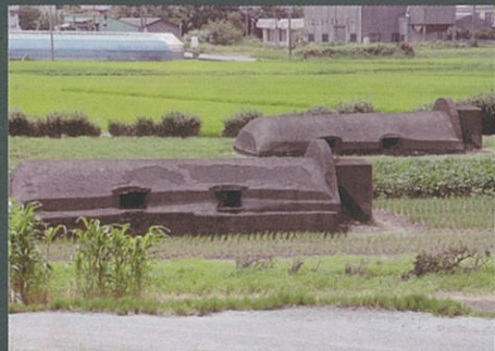
残そう歴史遺産 優秀賞 徳留 郁男