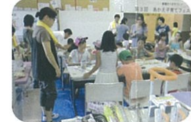
介護用品展示コーナー