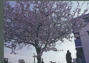
八重の散歩 村社 和秀