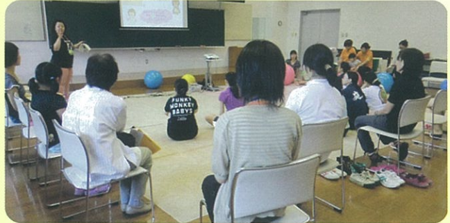
看護大学の先生による月経ヘルスケアプログラム