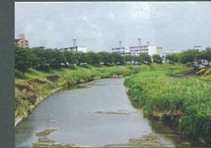
八重の新緑 村社 俊弘