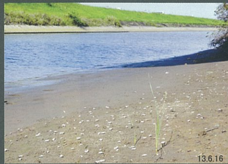
八重川干潟のカニたちシオマネキ 佳作 山本 栄一