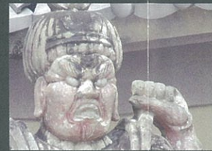
怒り 河野 美香