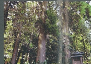
鎮守の社 有馬 誠治