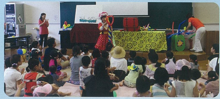
パネルシアター&ミニパレーンショー