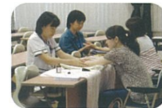
ハンドマッサージ