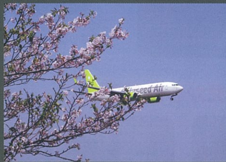
さくらの中から 佳作 園田 栄二