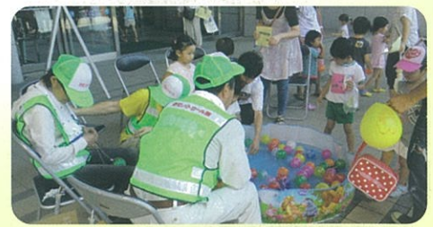
ヨーヨーコーナー