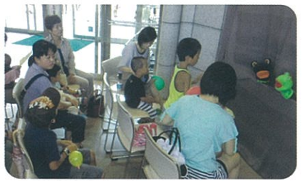
おたまちゃん劇場