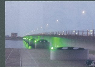
夕暮れの赤江大橋 落合 香織