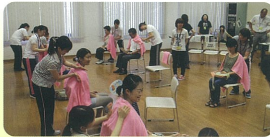
看護大生による肩もみ健康第一コーナー