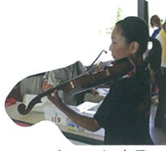
スタッフによるバイオリン生演奏