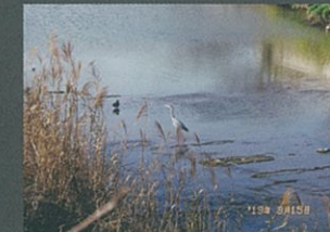
八重川の語らい(カモとアオサギ) 古木 進