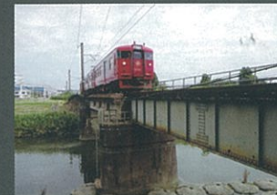
八重の赤鉄 村社 俊介