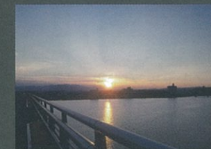
夕焼けの帰り道 渡邊 敬文