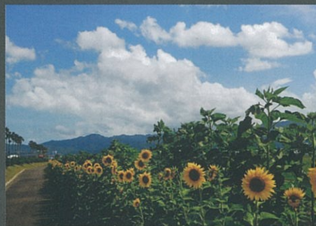
ひまわり咲く遊歩道 佳作 近藤 泰司