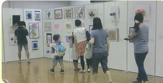
赤江まつばら支援学校作品展示