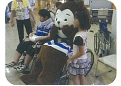
ハンディキャップ体験