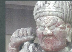
迫力のある金剛力士像 藤田 亜季