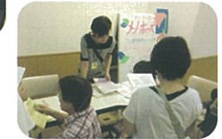
更年期をろうろコーナー