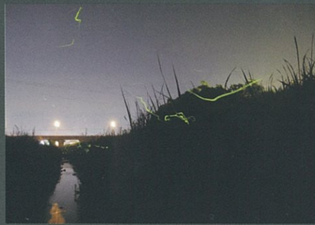
もどってきたホテル 佳作 飛松 國輝