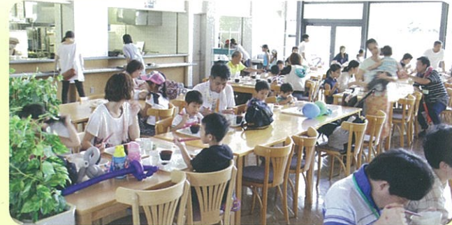
看護大の学食でキャンパスランチ