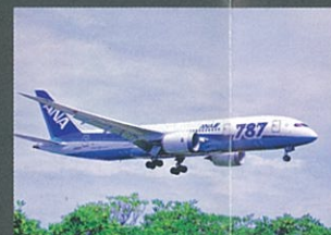
新時代の旅客機 元村 博之