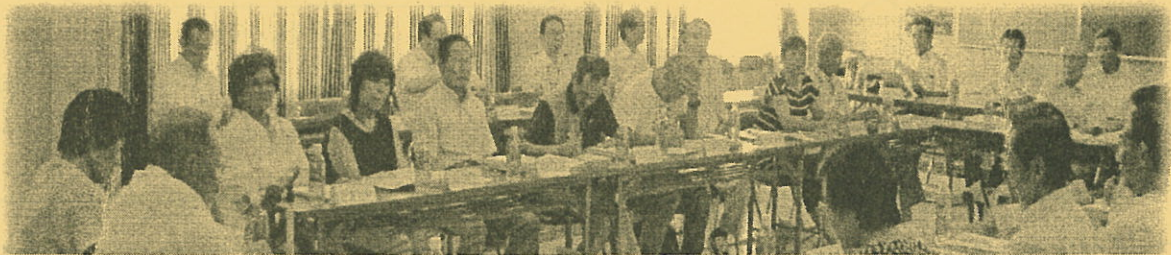
第 3 回赤江地域自治区地域協議会定例会

今後、地域内の各種団体で問題点、課題を検討していただき協議会の中でも検討していきたいと考えております。赤江地域協議会では、赤江地域に行政サービスの拠点が 1 箇所では足りないということで、今年 5 月に『赤江地域における地域事務所規模の行政サービスの拠点増設』の提言書を宮崎市に提出しています。