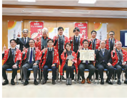
日本一になったことを喜ぶ関係者。