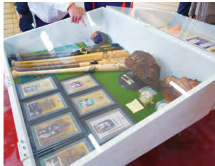
セレモニー当日は駅舎内で往年の選手が使用した用具などが展示されました。

#1 2021年の年間ぎょうざ 購入額・頻度ともに日本一に 2021年度の家計調査結果を総務省が公表し、「ぎょうざ」購入額、購入頻度、ともに本市が日本一になりました。「宮崎の餃子を新たな観光資源に！」をコンセプトに、2020年9月にぎょうざ専門店などで構成された「宮崎市ぎょうざ協議会」が設立。県内外でイベントを行うなど、一丸となって消費の促進に取り組んできました。2020年度は3位でしたが、2021年度の平均購入額は、これまで1位と2位を独占してきた宇都宮市と浜松市を抜いて本市が念願の1位、購入頻度は2年連続で1位に輝きました。今後、ぎょうざが宮崎の魅力の一端を担ってくれそうです。