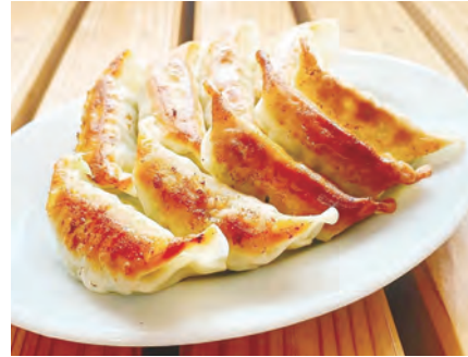
野菜や豚肉など宮崎の農畜産物で作る宮崎ぎょうざ。

#1 2021年の年間ぎょうざ 購入額・頻度ともに日本一に 2021年度の家計調査結果を総務省が公表し、「ぎょうざ」購入額、購入頻度、ともに本市が日本一になりました。「宮崎の餃子を新たな観光資源に！」をコンセプトに、2020年9月にぎょうざ専門店などで構成された「宮崎市ぎょうざ協議会」が設立。県内外でイベントを行うなど、一丸となって消費の促進に取り組んできました。2020年度は3位でしたが、2021年度の平均購入額は、これまで1位と2位を独占してきた宇都宮市と浜松市を抜いて本市が念願の1位、購入頻度は2年連続で1位に輝きました。今後、ぎょうざが宮崎の魅力の一端を担ってくれそうです。