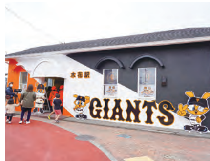
ジャイアンツのロゴとマスコットが描かれたジャイアンツカラーの駅舎。

#2 木花駅が ジャイアンツカラーに一新 プロ野球読売巨人軍のキャンペーン前にJR日南線木花駅の駅舎が球団のイメージカラーに塗り替えられ、1月29日に完成披露のセレモニーが行われました。木花地域の住民でつくるボランティア団体「木の花サポーターズネットワーク」と宮崎大学の学生有志が企画。「巨人軍と地域の絆をさらに深めていきたい」と寄付を募り、駅舎の外壁をジャイアンツカラーのオレンジと黒と白色の3色に塗り替えました。今後は駅周辺で継続的なイベント開催に取り組みしていきます。ジャイアンツカラーの駅舎はキャンピング地宮崎の新たなシンボルとなりそうです。