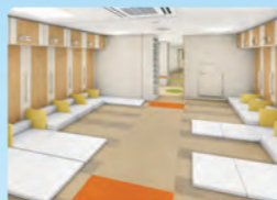
ツーリスト (定員30名)

段差をなくし手すりをつけたバリアフリーの客室や、ペットと一緒に過ごせるウィズペットルーム、一人でゆっくりと過ごせるシングル個室など、さまざまなニーズに対応できるよう全部で11タイプの客室がそろっています。また、個室を大幅に増設し、よりプライベートな空間で船旅を楽しんでいただけます。