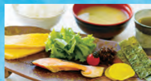
船内レストランの朝食 (例)