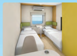
ファーストツイン (2名用)