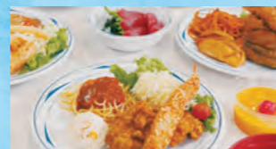
船内レストランの夕食 (例)