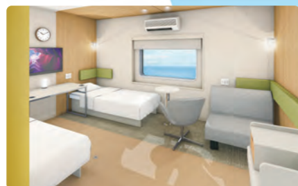
プレミアム バリアフリー (2~3名用)