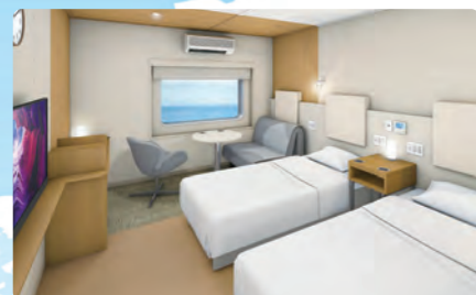
プレミアムツイン (2~3名用)

バリアフリー対応やペットと過ごせる客室など ワクワク楽しくなるお部屋が勢ぞろい!