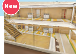
イベントステージ