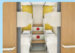
ドミトリー (定員252名)