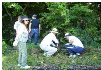
— 防犯・防災部会 — 9月16日 海拔5mラインの仮杭打ちの様子