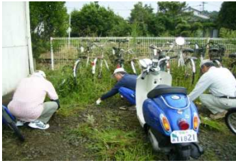
— 環境整備部会 — 9月13日 木花駅舎清掃の様子