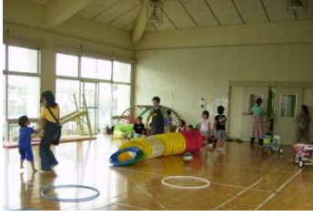
— 地域福祉部会 — 9月26日 おばあちゃんの子育て事業の様子