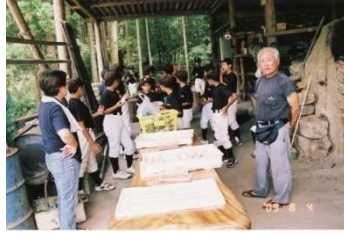
— 教育・文化スポーツ部会 — 8月4日 「郷土を知ろう」事業の様子