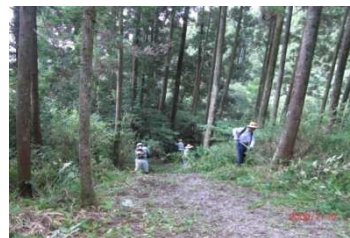
— 地域再生部会 — 7月19日 木花台公園遊歩道整備の様子