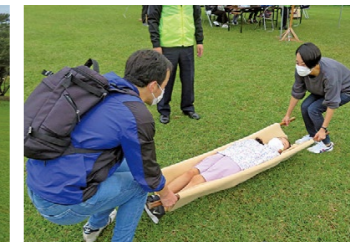
毛布で作る簡易担架