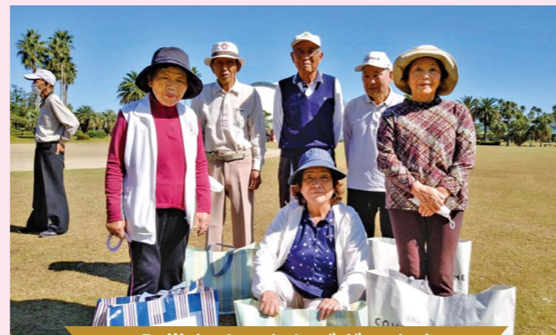
入賞おめでとうございます