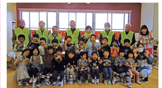
加江田保育園(12月21日)