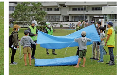
ブルーシートでテントを作ろう