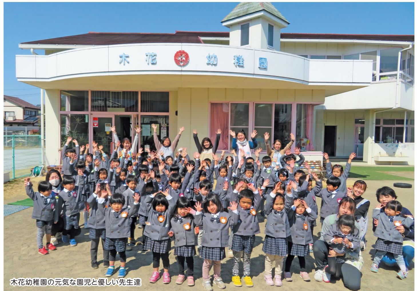
木花幼稚園の元気な園児と優しい先生達

〒889-2151 宮崎市大字熊野591(木花地域センター内) TEL:58-0044(事務局)