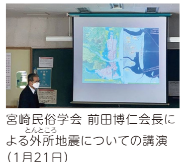
宮崎民俗学会 前田博仁会長に とんところ よる外所地震についての講演 (1月21日)