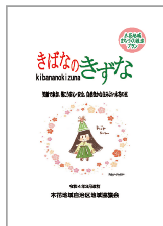
きばなのきずな冊子版(表紙)

改訂された「きばなのきずな冊子版」と「マップ版」については、自治会を通して加入世帯の皆さまに配布を予定しています。