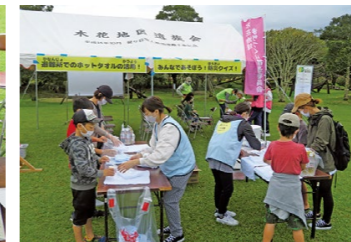
避難所でのホットタオル活用