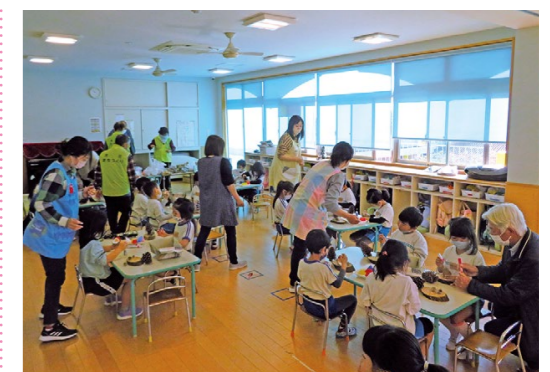
木花こども園(12月15日)