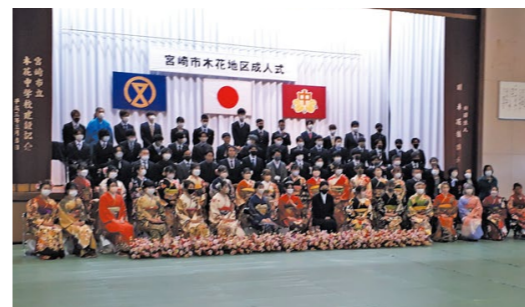
2年ぶりの木花地区成人式