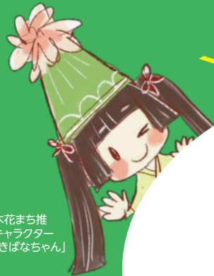
木花まち推 キャラクター 「きばなちゃん」