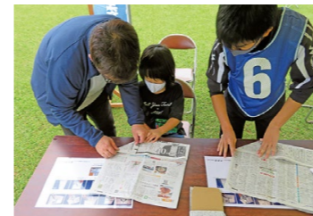
新聞でスリッパを作ろう

ドローン操縦体験、けむり体験ハウス、起震車等たくさんのブースで色々な体験ができました。私たちも6つのコーナーを設け高校生ボランティアも参加し、新聞紙スリッパ作りを熱心に指導してくれました。午前中は207名、午後からは214名の参加者で盛り上がりました。