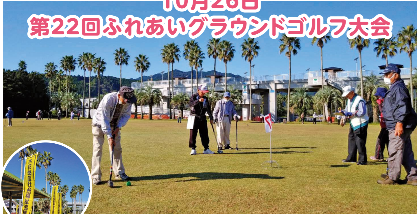
2年ぶりの開催で44名の参加があり、親睦と体力づくりに励みました。