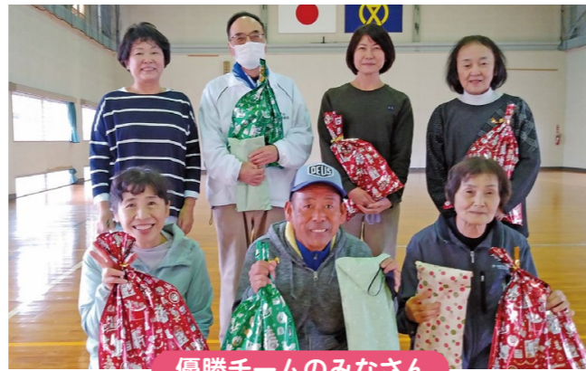
優勝チームのみなさん

ふうせんバレーは、子どもから高齢者の方、障がいのある方も、同じコートの中で一緒に楽しめるスポーツです。