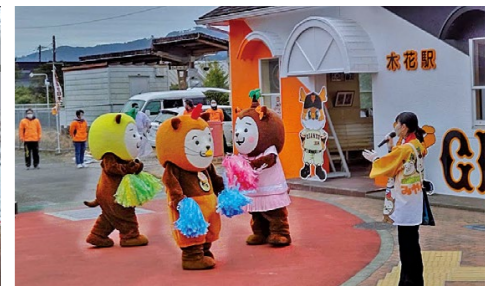
みやざき犬がお祝いのダンスを披露