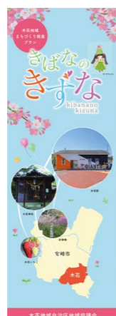
きばなのきずなマップ版