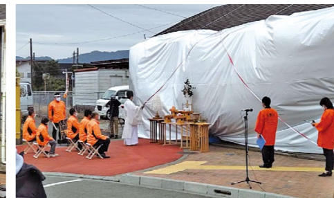
ドキドキ!いよいよお披露目です!