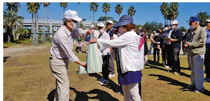
最後は抽選会で盛り上がり、楽しい1日でした。