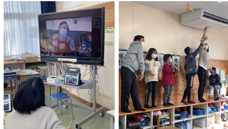
〈TVモニターをつかった遠隔授業〉〈作ったおもちゃで遊ぶ児童たち〉

鏡洲小学校から全校生徒を対象にした指導の要請依頼がありました。1月からの急なコロナ感染拡大を考慮して、3密回避になるよう両者で検討し、児童を4グループに分け、教室も4教室で実施しました。学校サイドも遠隔授業を運用し、メインの指導者1人が各教室に設置してあるTVモニターと生徒の持つタブレット端末を通じて指導を行い、各教室にサブ指導者がフォローを行うという形で取り組みました。