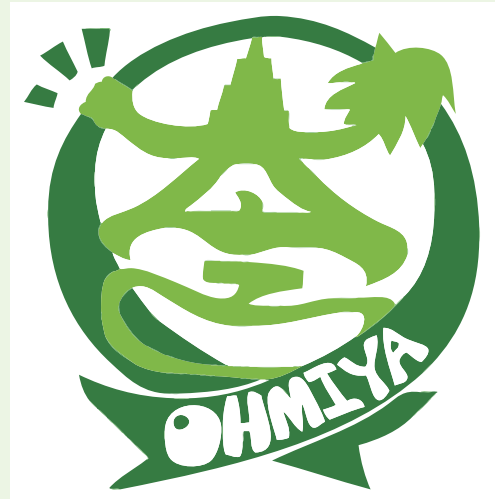
大宮地域のシンボルマーク