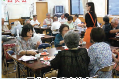
下北方町南自治会

8月までに6回開催、10月中に4回の開催が予定されております。暑い夏も過ぎ心地よい秋の風を感じるこの時期から開催が増えてきます。市社協や地区社協の補助金や支援を利用し、多くの開催をお願いします。