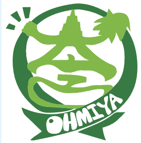
大宮地域のシンボルマーク

スローガン 地域の歴史や文化と豊かな自然を大切にする 元気でやさしいまち『大宮』