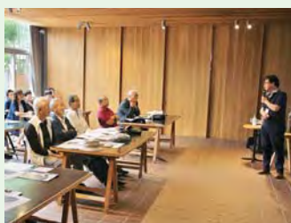
「油津まちづくり」研修