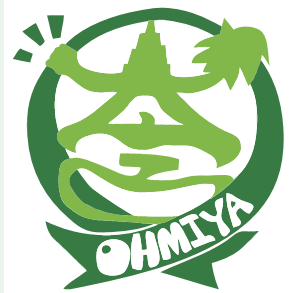
大宮地域のシンボルマーク

スローガン 地域の歴史や文化と豊かな自然を大切にする 元気でやさしいまち『大宮』