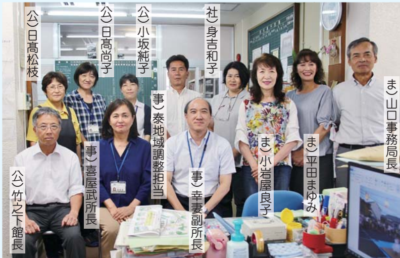
事) 大宮地域事務所 公) 大宮公民館 社) 大宮地区社会福祉協議会 ま) 大宮地域まちづくり推進委員会