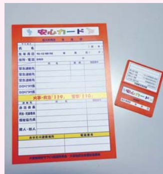
2タイプの 安心カード

「安心カード」には、冷蔵庫等にぶら下げるタイプと財布やカードケースにはいる携帯用タイプがあります。どちらも緊急時に頼りになる便利なカードです。