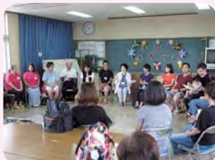
語ろう会(中会議室)