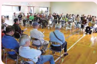
災害ボランティアセンター運営訓練