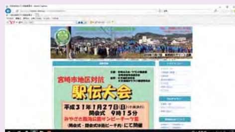
大宮地域まちづくり推進委員会ホームページ (裏表紙にQRコードを載せています)

尚、昨年立ち上げたホームページの更新は、事務局で実施し費用の削減努力をしております。