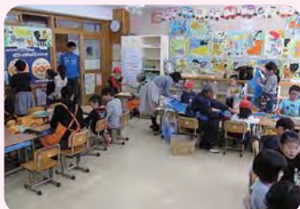
福祉体験教室(あおぎり祭)