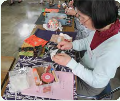
木目込み人形を作ろう