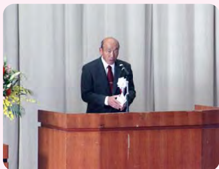
時任実行委員会会長あいさつ

前日準備から当日の片付けまで、大宮中学校の先生方や生徒さんをはじめ、実行委員会の皆様、ご協力くださいました地域の皆様に心から感謝申し上げます。ありがとうございました。