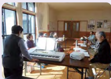
下北方ふれあい歌の会