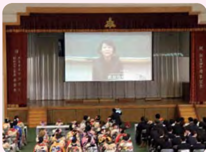
恩師からのビデオメッセージ