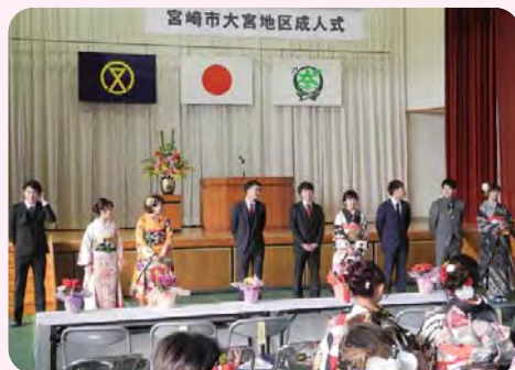
新成人実行委員の皆さん 企画運営、頑張りました!