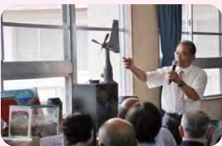
福祉協力員研修会