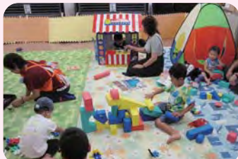
遊ぼう会(地域事務所会議室)