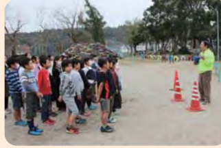
防災ベンチの説明