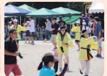
「宮崎城址音頭」の披露