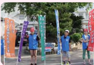
のぼり旗でのあいさつ運動