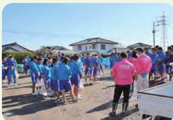
参加してくれた中学生