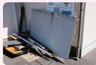
台風により壊れたあいさつ看板