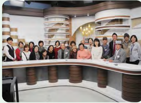
楽しさ体感!バラエティ大宮② 放送局見学(UMKテレビ宮崎・FM宮崎)

「スタジオ見学の後、今までとは違った目でニュースを見ています。色々な体験ができて楽しい講座でした。」