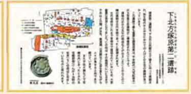
下北方塚原第2遺跡解説看板