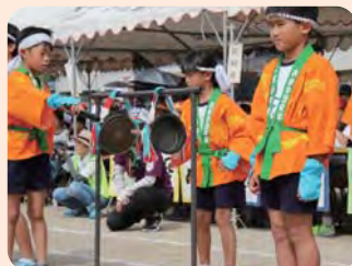
六月踊り(大宮小運動会)