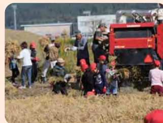
稲刈り指導(大宮小)