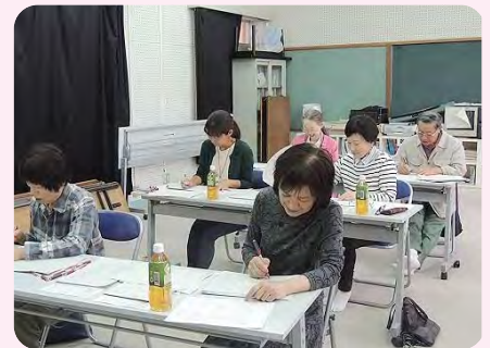
大宮中の赤ペン先生

ボランティアで小中学校の行事や授業を手伝っておられる地域の方々に支援しています。