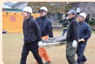
要支援者救助訓練

また自治会単位の防災訓練では、花ヶ島町観音免と花ヶ島町新地橋自治会が花ヶ島緑地公園で初めての合同訓練を行い約150名を越す参加がありました。特に要支援者を避難させる為、リヤカー、担架を使った救助訓練、炊き出し訓練、煙ハウス体験、消火訓練があり、実際に即した訓練でした。