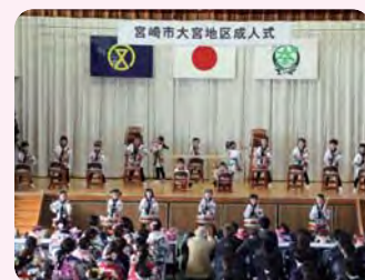
大宮中、池内小、大宮小、下北方保育園の皆さんから心のこもった温かいお祝い♪