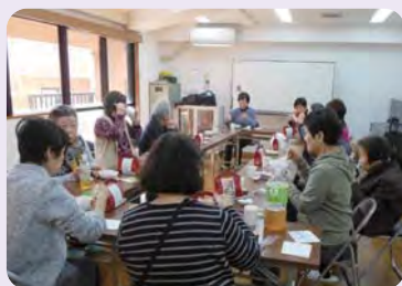
ダイアパレスふれあいサロン

地域の高齢者が歩いて集まることができる場所で、みんな一緒にゲームや体操、おしゃべりなどを楽しむ「ふれあい茶話会」の立ち上げや継続を支援をしています。