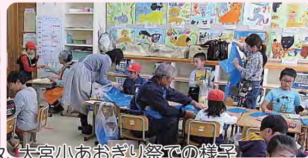
池内小ふれあいフェスタ、大宮小おおぎり祭の様子