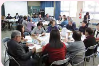
福祉施設との情報交換会