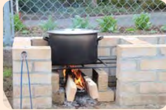
防災ベンチかまど使用の訓練