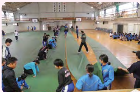
会場の準備・片付け、式の進行などで地区の方や中学生が大活躍