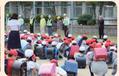
見守り隊との対面式(池内小)