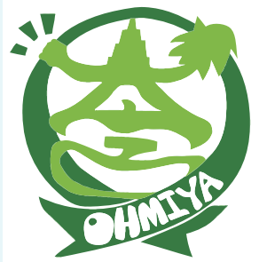
大宮地域のシンボルマーク

スローガン 地域の歴史や文化と豊かな自然を大切にする 元気でやさしいまち『大宮』