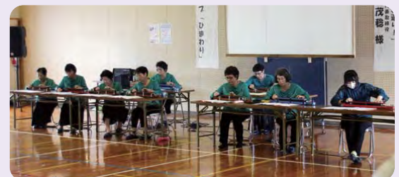
大正琴グループ「ひまわり」によるアトラクション