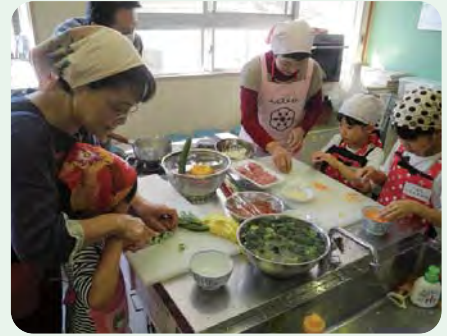
親子でクッキング!

「スタジオ見学の後、今までとは違った目でニュースを見ています。色々な体験ができて楽しい講座でした。」