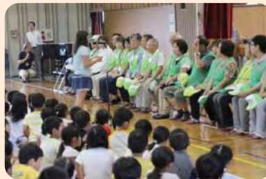
感謝の言葉を伝える児童(大宮小)