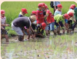
田植えの指導(大宮小)

特に「六月踊り」、「宮崎城址音頭」は、大宮小、池内小の運動会で保存団体の指導により児童が踊りを披露しています。また雨ごいの踊りとの伝承から、「六月踊り」保存会は、田植え、稲刈りの学習指導にも参加しています。