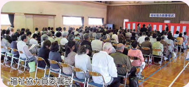
福祉協力員委嘱式