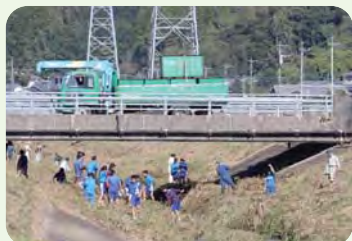
クリーンアップ作業