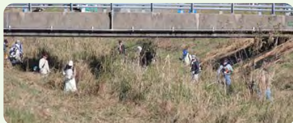
ボランティアによる草刈り作業