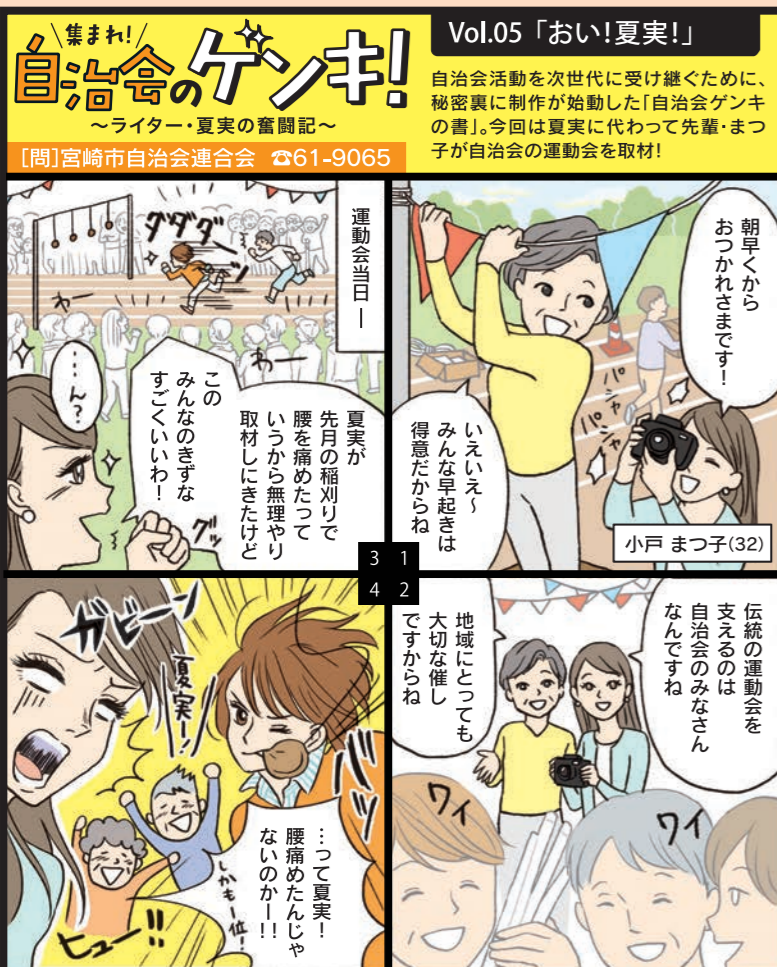
※市内の自治会活動を参考に、架空の自治会として紹介しています。