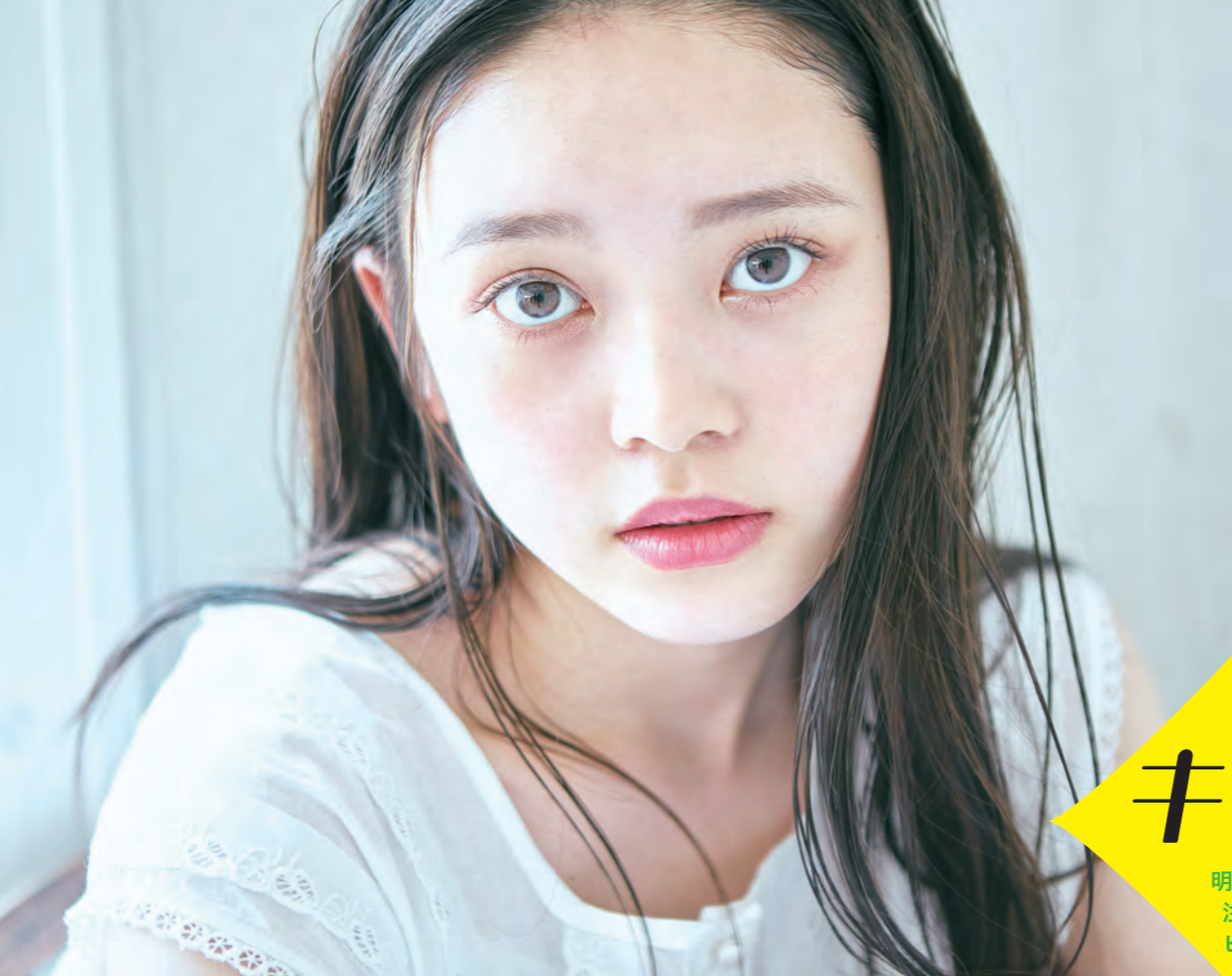
たかいし 高石 あかりさん 宮崎市出身俳優