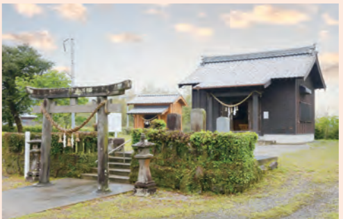
歴史を感じさせる石づくりの鳥居と石垣の奥に建つ新しい社殿