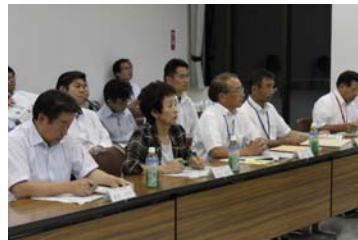
オブザーバーの皆様