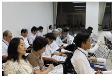
熱心に聞き入る傍聴席