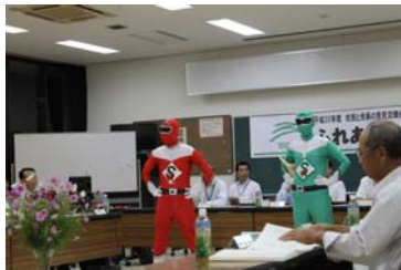
健康戦隊カイゼンジャー登場